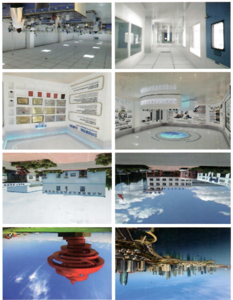
美丽的海滨城市青岛