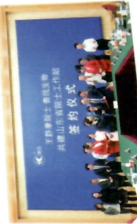
与天津大学合作建立山东省院士工作站