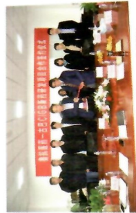
中古国际生物技术转化平台签约