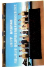
山东大学-鲁抗医药微生物技术研究院成立