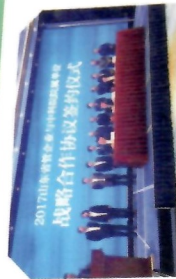
山东省工业生物技术产业转化平台成立

专业：药学、英语、西班牙语、国际贸易等 学历：本科、硕士 培养方向：科员→主管→高级主管→经理助理 薪酬：底薪+提成