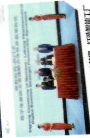
西门子战略合作协议签署 打造智能工厂