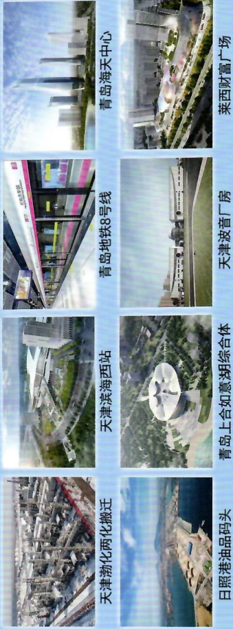
日照渤化两化搬迁

下设济南、青岛、石化(淄博)、天津、中原(郑州)五大分公司及海外事业部，经营范围覆盖山东、京津冀、河南、东南亚等，陆续承建了烟台裕龙石化，青岛如意湖高端机电，天津波音厂房EPC，郑州地铁3号线3号工程等，综合实力稳居国内专业领域领先地位。